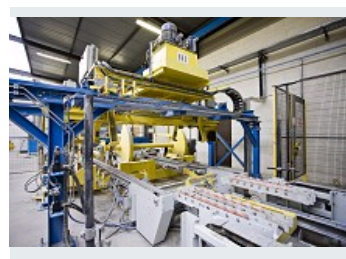
MANUTENTION DE CHARGES LOURDES