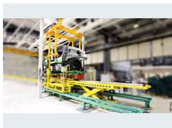
POSTE DE MARIAGE